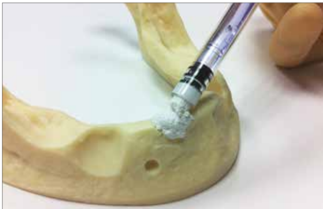
▲ Abb. 1: Applikation von In'Oss™ direkt aus der Spritze

Es wird empfohlen, nach Einbringen des Materials den Defekt entweder mit einer Membran oder – wenn ausreichend vorhanden – der Mukosa abzudecken und speicheldicht zu vernähen.